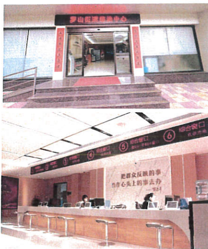
基层治理中心一楼便民服务中心大厅 政务公开专区