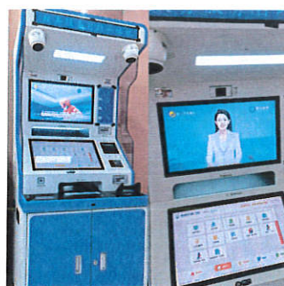
政务公开专区自助一体机播放查阅点