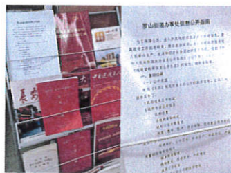
政务公开专区查阅点