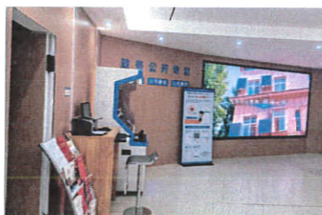
政务公开专区搭配LED电子显示屏全景

4、依托街道基层治理中心设置政务公开专区。 政务公开专区升级改造后，各项工作有效运营，运用多功能政务自助机每月滚动播放公开信息，群众也可通过大厅电脑自助上网查询打印，丰富了公开载体，拓宽了宣传渠道，政府信息公开工作日常运转更加方便快捷。