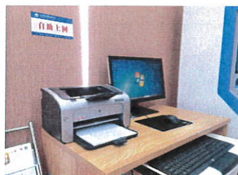
政务公开专区自助上网配套区域