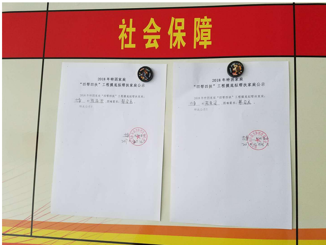
注：公开社会救助材料