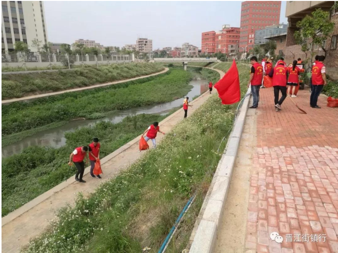
注：组织河道治理党建活动

（三）深化放管服改革。 于 2017 年底重新改造永和镇便民服务中心，优化便民窗口环境，整合窗口，现有 2 个综合窗口，8 个业务窗口。规范便民服务中心制度流程，公开制度上墙，召开窗口工作人员培训会，提升窗口人员业务能力，不断提升群众满意度。