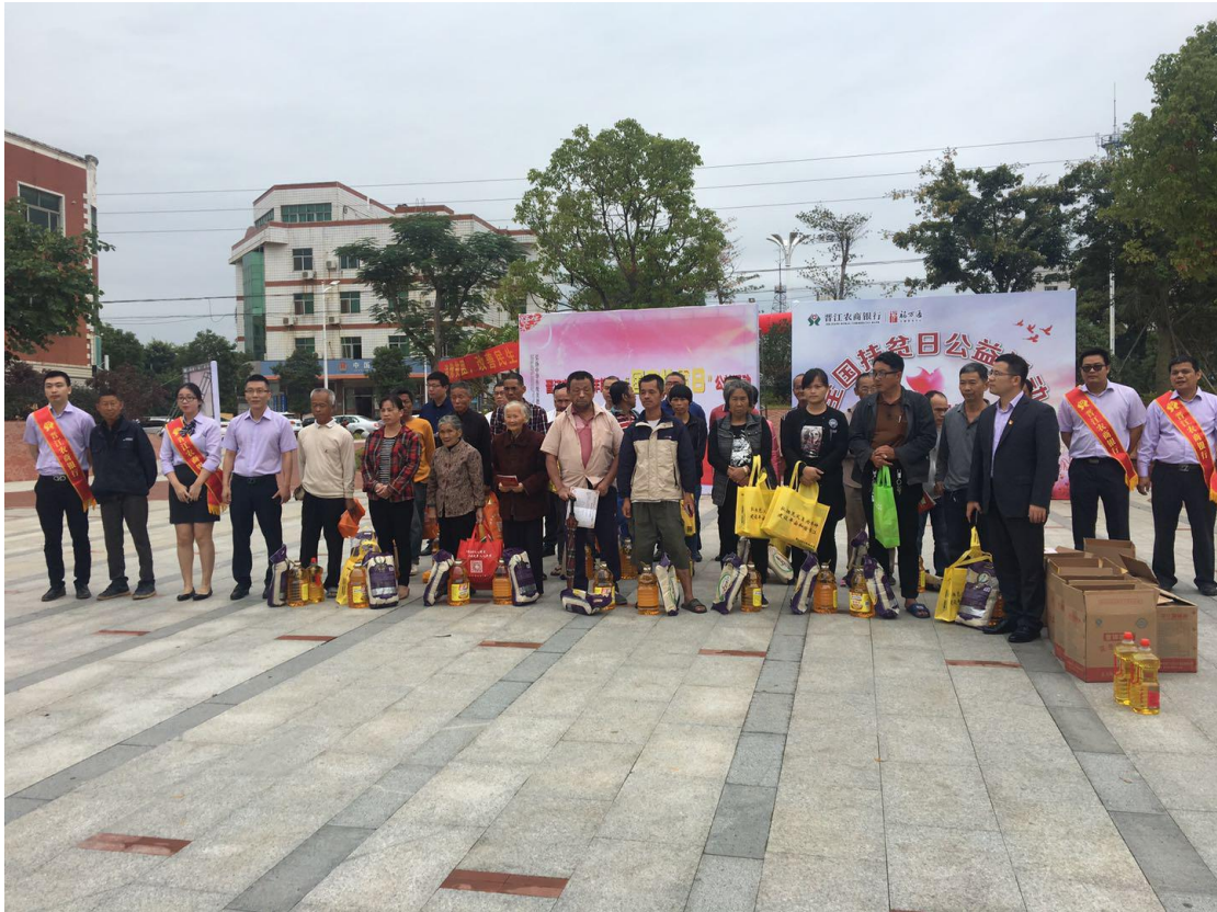
注：永和镇召开第五个国家扶贫日公益活动。