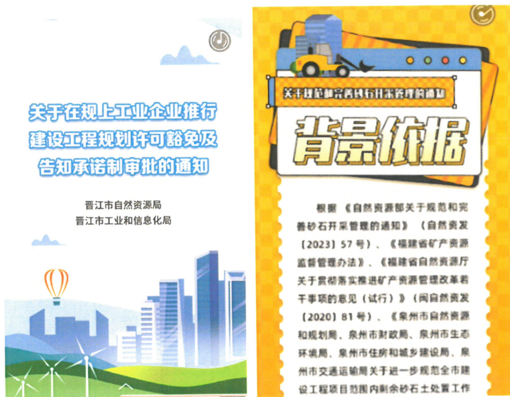
（政策解读 H5 页面）

1、持续加强政府信息发布常规工作。2023年我局强化用地用海要素保障，以月度清单形式公开土地出让信息12份、划拨12份、临时用地3份、用海预审2份、海域使用权设立3份，公开规划许可583件，并同步向图书馆、档案馆备案；2、落实规范性文件公开和解读。印发并公开规范性文件5份，同步运用图文、H5页面丰富解读方式，更好地解答企业群众关心关注的热点问题。