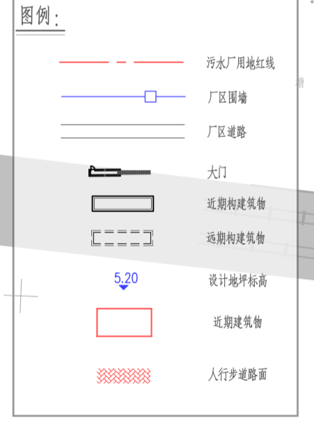
污水厂总平面布置图