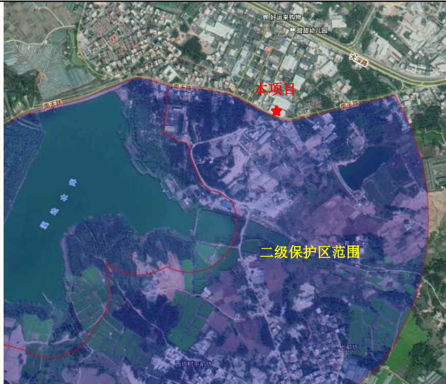
图 1-1 项目与溪边水库水源保护区位置关系图