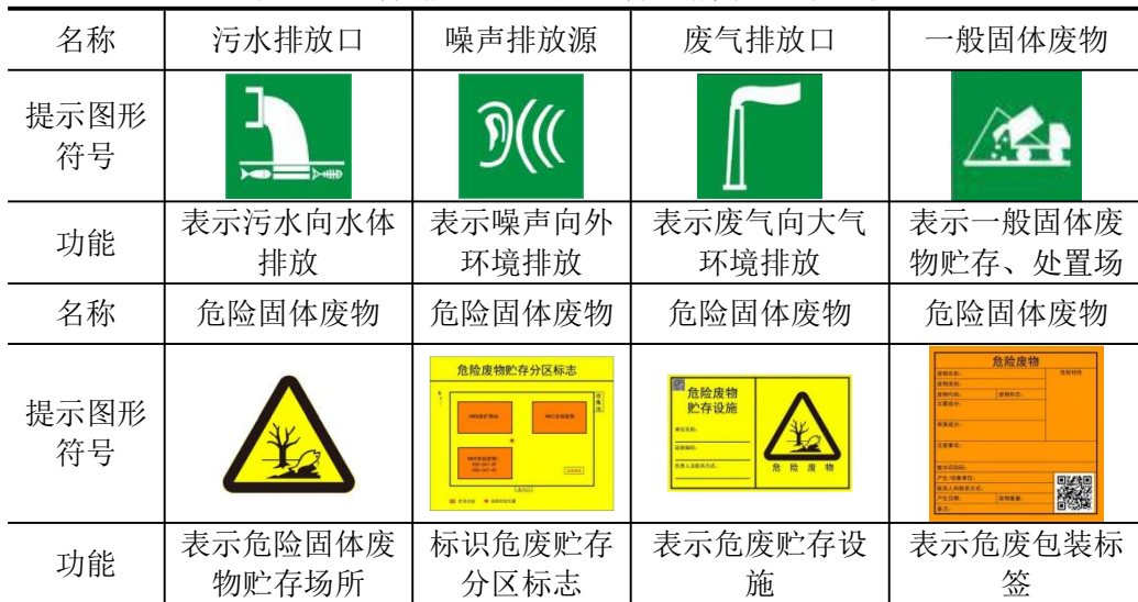
表 5-2 各排污口（源）标志牌设置示意图

根据国家标准《环境保护图形标志—排放口（源）》（GB15562.1-1995）、《环境保护图形标志—固体废物贮存（处置）场》（GB15562.2-1995）和国家生态环境部《排污口规范化整治要求》（试行）的技术要求，企业所有排放口（包括水、气、声、渣）必须按照“便于采样、便于计量检测、便于日常现场监督检查”的原则和规范化要求，设置与之相适应的环境保护图形标志牌，绘制企业排污口分布图，同时对污水排放口安装流量计，对治理设施安装运行监控装置、排污口的规范化要符合有关要求。图形符号见下表。