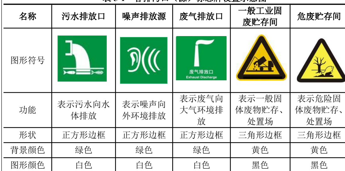
表 5-1 各排污口（源）标志牌设置示意图