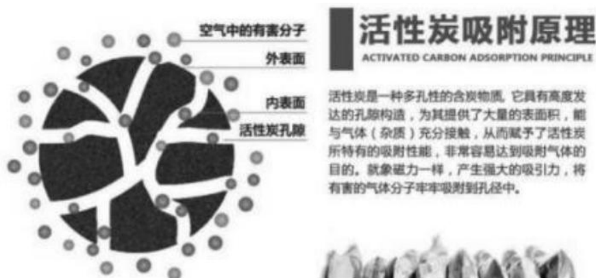
图 4.1-1 活性炭吸附原理图