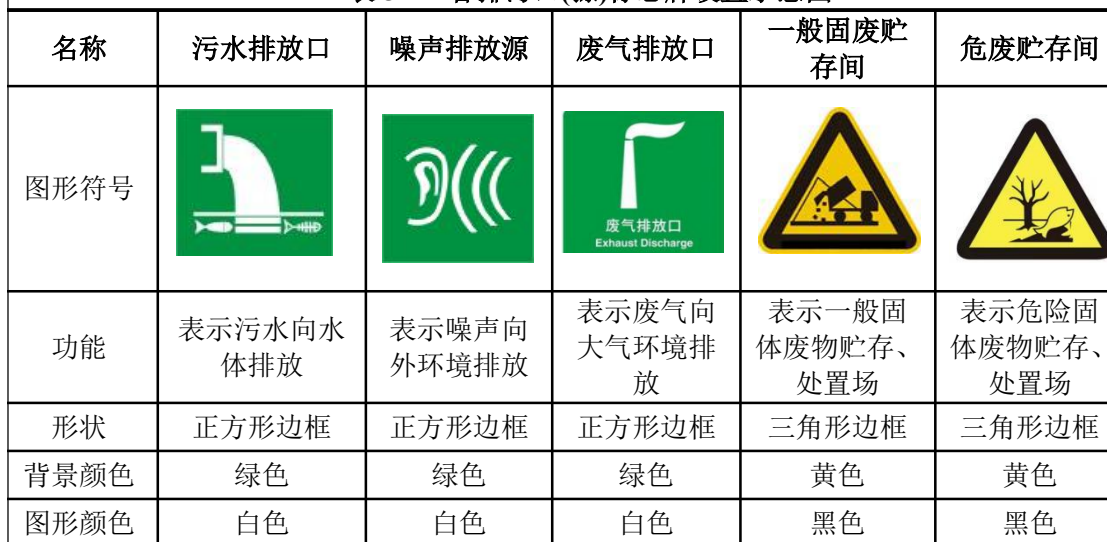
表 5-1 各排污口(源)标志牌设置示意图