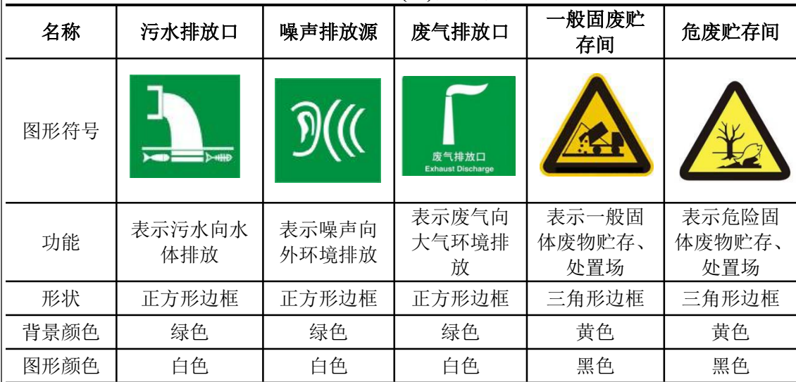
表 5-1 各排污口(源)标志牌设置示意图