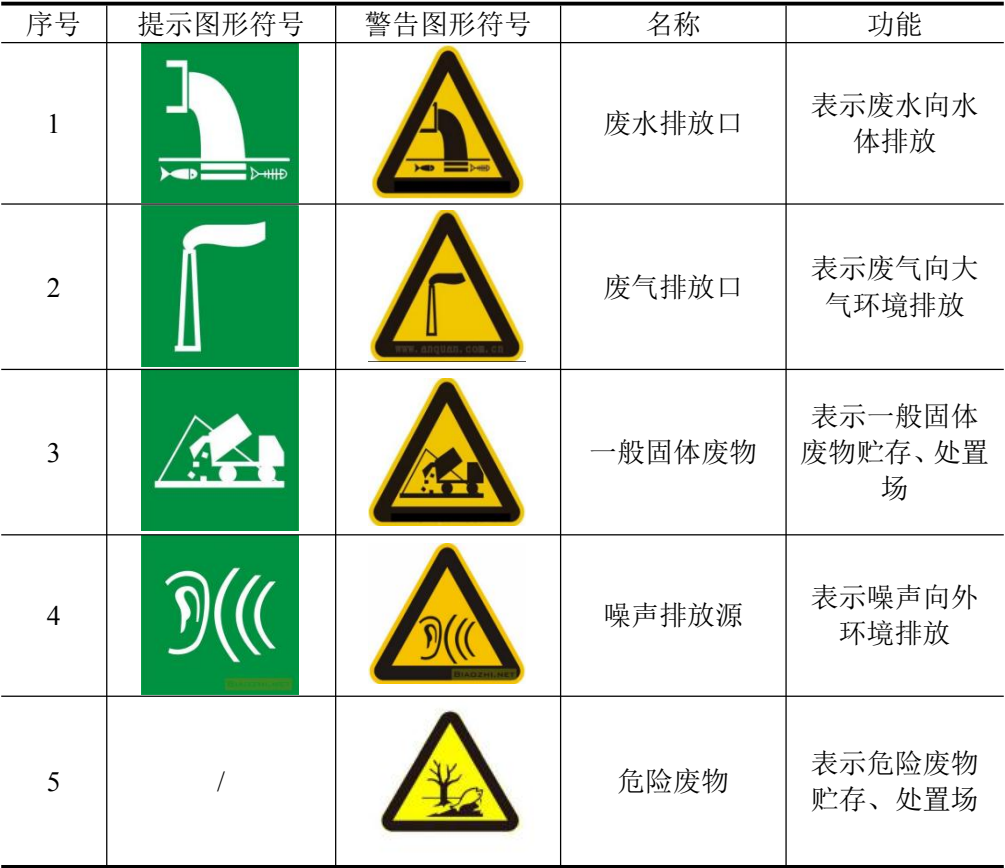
表 5-1 各排污口（源）标志牌设置示意图

建设单位于 2025 年 12 月 17 日在生态环境公示网进行第一次网络公示，于 2025 年 12 月 31 日进行第二次网络公示，截至公示结束，本项目环评信息公示期间建设单位、技术单位尚未收到任何单位和个人的电话、传真、信件或邮件信息反馈。