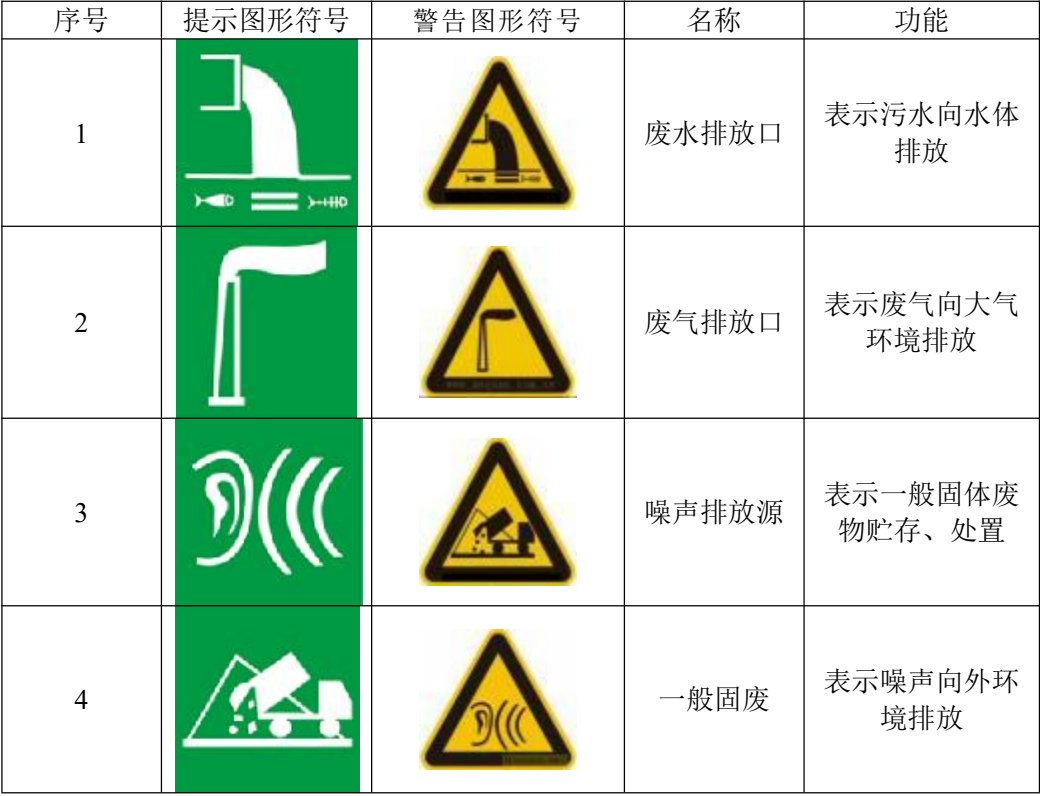
表 5-2 各排污口（源）标志牌设置示意图

要求各排污口（源）提示标志形状采用正方形边框，背景颜色采用绿色，图形颜色采用白色；警告标志形状采用三角形边框，背景颜色采用黄色，图形颜色采用黑色。按照《排污口规范化整治技术要求（试行）》相关规定，标志牌应设在与之功能相应的醒目处，并保持清晰、完整。图形符号见下表 5-2。