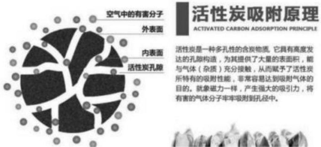
图 4.1-1 活性炭吸附原理图

本项目选用碘值 \geq 800\text{mg/g} 、比表面积 \geq 850\text{m}^2/\text{g} 、孔径分布以 2-5nm 中孔为主的煤质蜂窝活性炭作为核心吸附材料，煤质蜂窝活性炭具备中孔占比 60%以上的孔隙结构，可快速捕捉目标污染物，且机械强度高、耐气流冲击性强，同时，蜂窝状结构便于模块化填装与更换，适配本项目多产污点集中处理的需求。