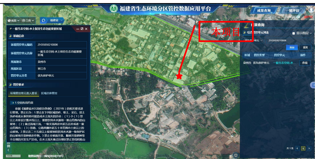
图 1.1-2 生态分区管控查询结果