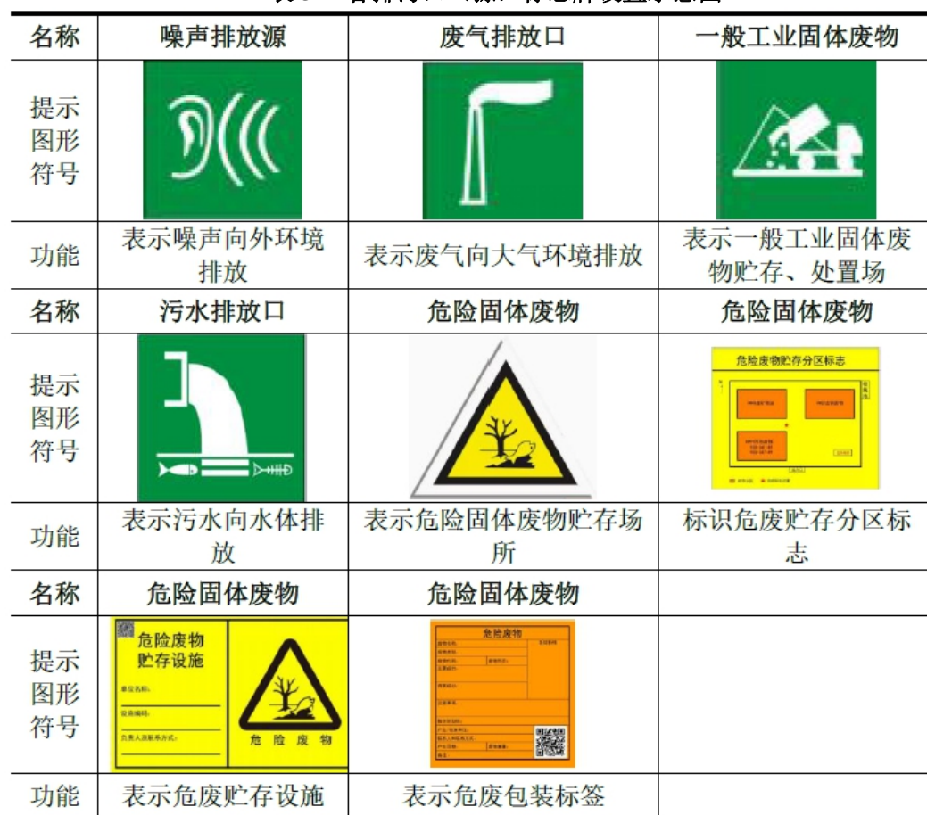
表 5-1 各排污口（源）标志牌设置示意图