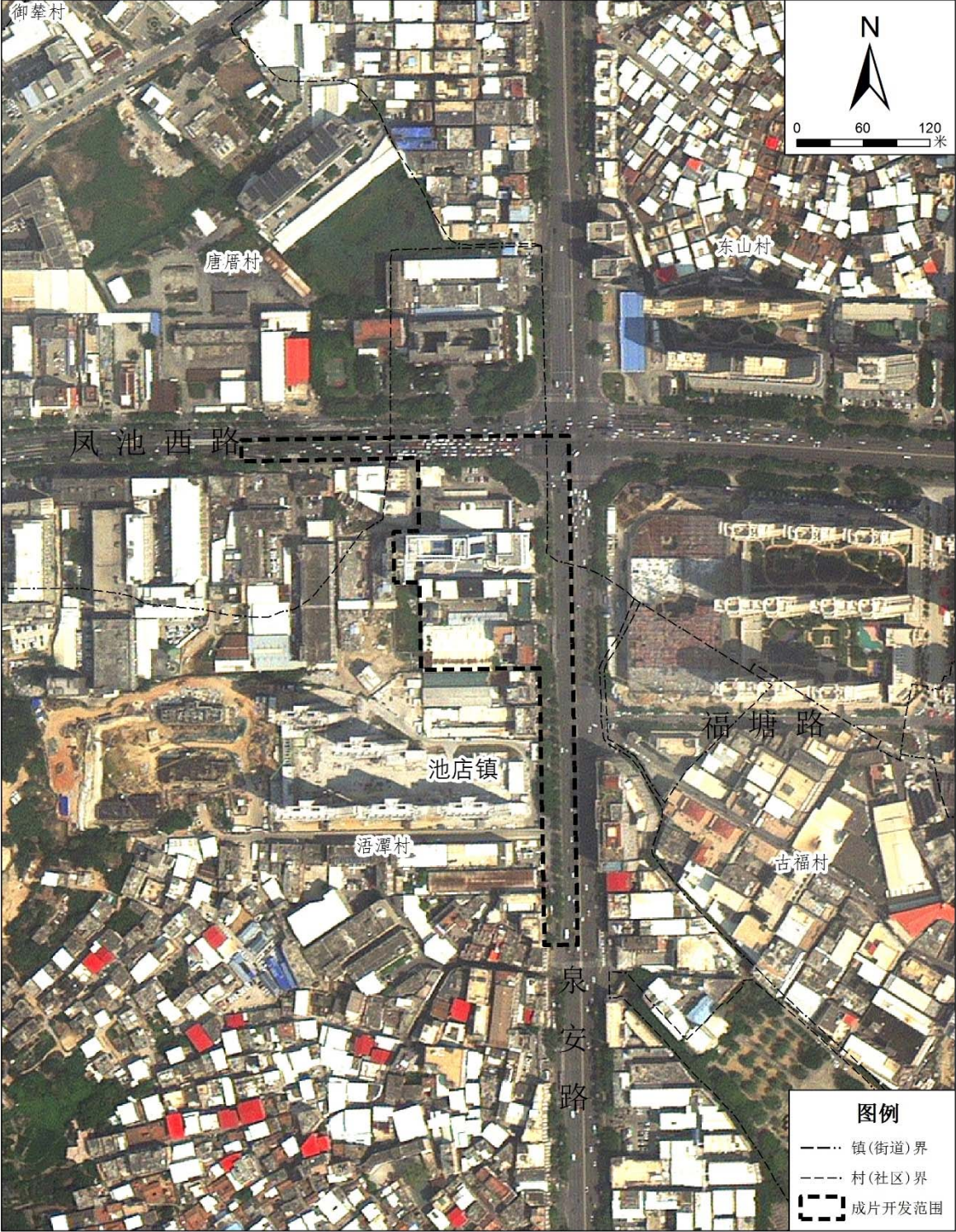
附图 1: 位置示意图