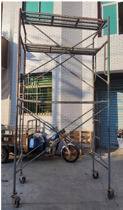
图 2 唐*钦拆除电缆时使用的移动式门型架操作平台