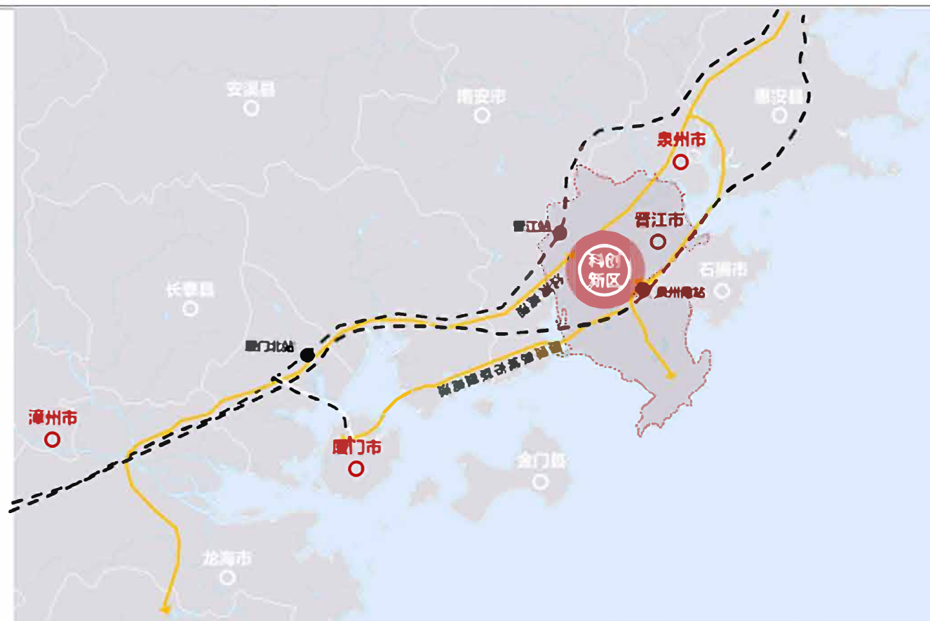
科创新区在泉厦漳走廊的位置