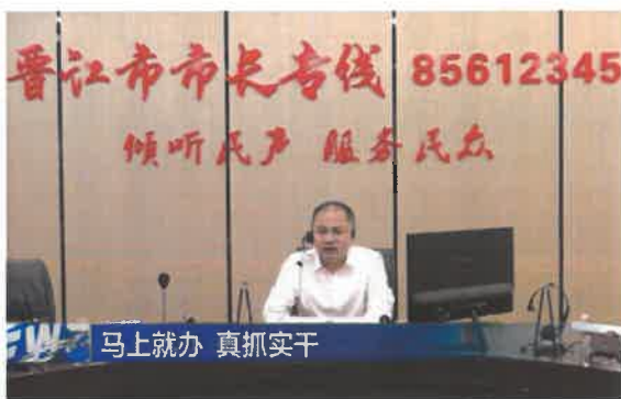
轮值接听“市长专线”

全年在晋江市人民政府网站主动公开信息 58 条，主要涉及项目建设、部门财政预决算和工作动态等领域。二是深化媒体矩阵。截至 2022 年底，微信公众号“晋江市林业和园林绿化局”累计公众号用户关注数达 3033 人，年度发布和转载各类信息 291 篇，阅读人次达 8.4 万人次，内容涵盖野生动植物保护、城市园林绿化、林业执法、疫情防控、政策解读等方面。三是回应群众关切。强化人大代表建议和政协提案办理工作，承办的 18 件建议提案见面率、答复率、满意率均达到 100%；轮值接听“市长专线”2 次，回应群众关注的城乡绿化、林长制工作等热点问题；采取“一呼即应、回访点评、颁发证书”等方式，上下联动、左右衔接，及时办理野生动物保护、公园管理等问题诉求 900 余件，切实以“民智”促“民生”，主要做法和工作成效被国家级主流媒体报道。