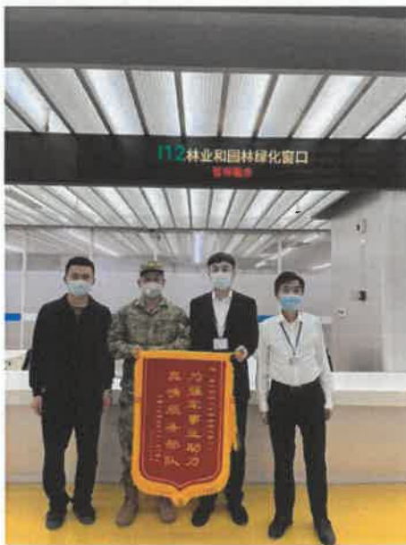
政策解读获赠锦旗

询“上门”服务并用心解决“疑难问题”获赠锦旗。三是拓宽宣传维度。协同晋江经济报、晋江新闻网、泉州晚报等媒体，加大对森林防火、植树造林、野生动植物保护等工作的宣传报道，努力搭建以单位为主、媒体为辅、部门联动的宣传平台。同时，积极向省级以上媒体推送信息，野生动物保护等多篇信息获央视新闻报道。