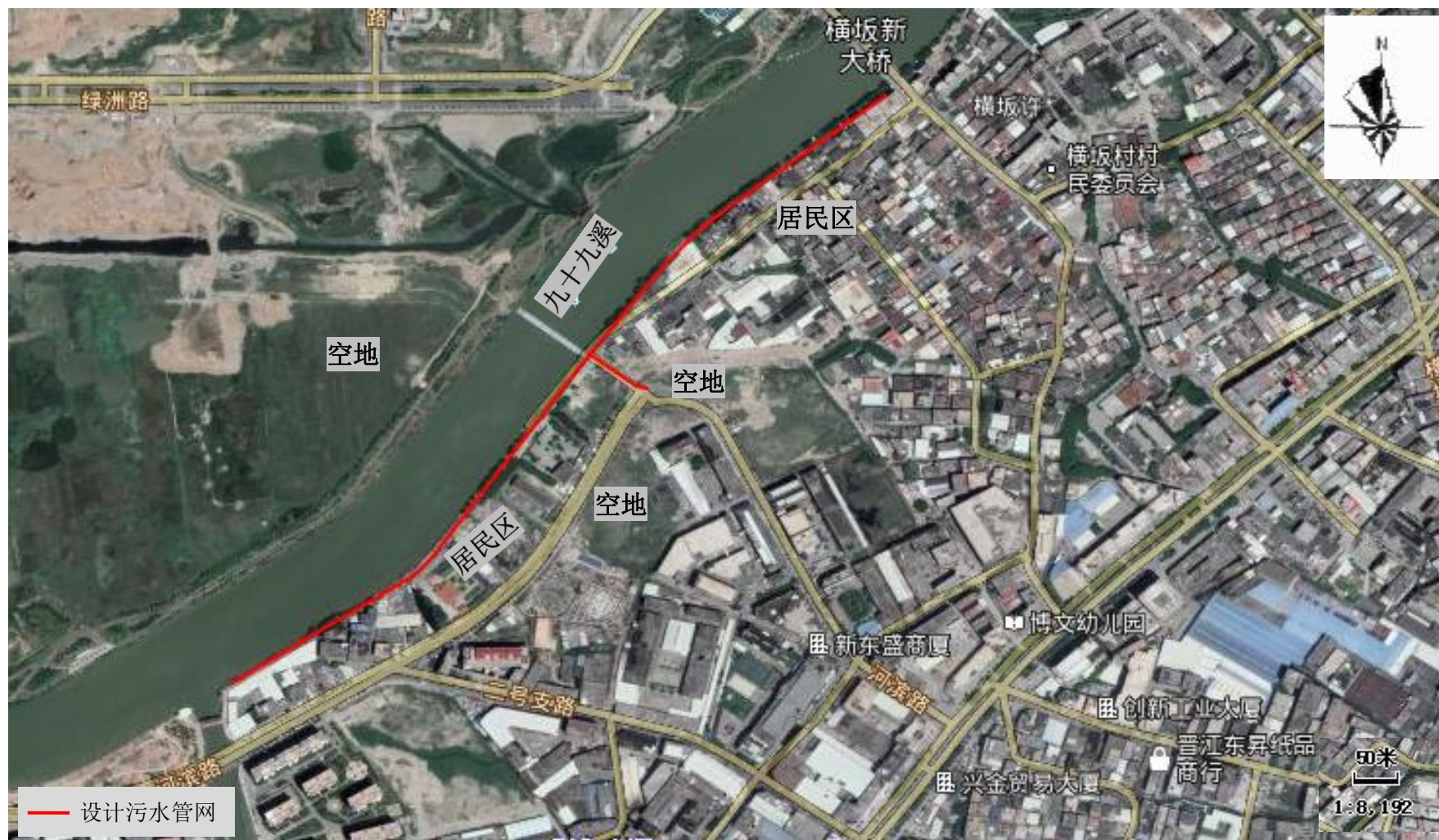
附图 2 项目周边关系图