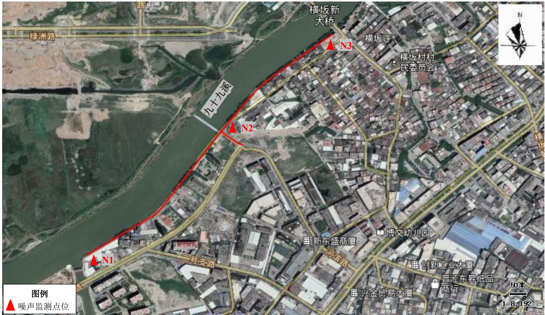
附图 5 噪声监测点位图