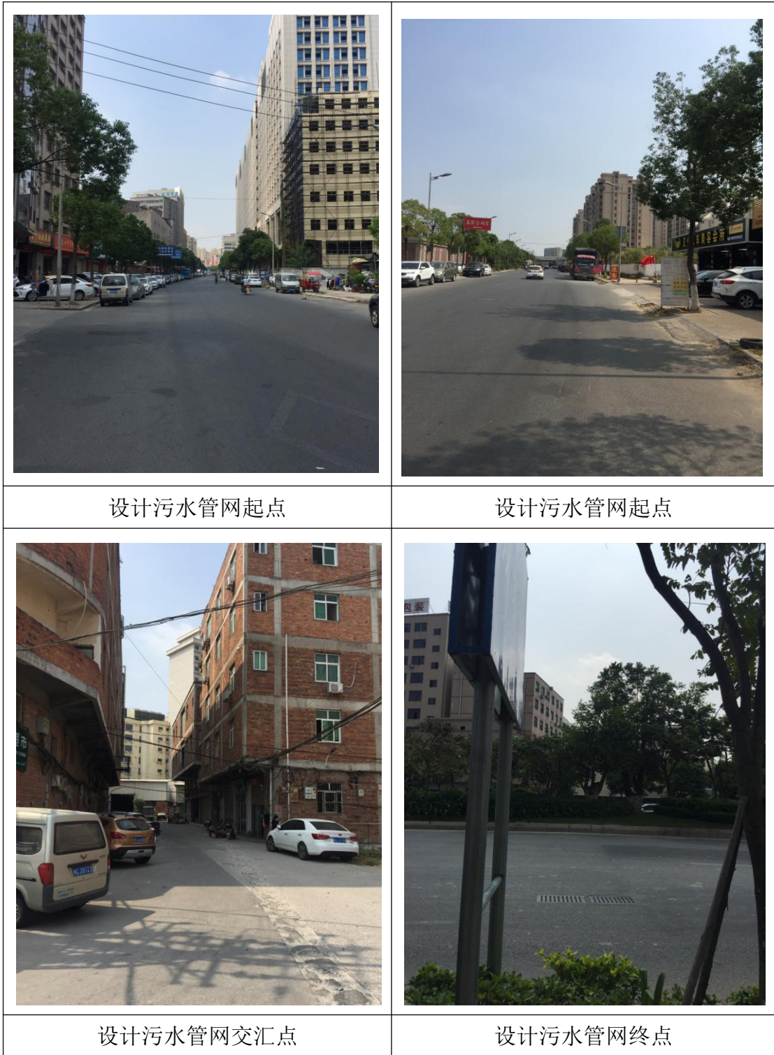
附图 3 项目周边环境现状图